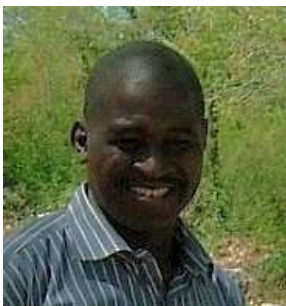
LES VŒUX DE TERIYA

Je pense plus particulièrement et naturellement à celles et ceux qui ont permis la réalisation d'un conteneur qui sera acheminé à Sikasso à la fin janvier : les donateurs publics et privés, l'Agglo qui a assuré le stockage des équipements, les volontaires investis dans le tri, la réparation et le conditionnement des matériels, l'équipe logistique qui a réussi la prouesse de charger et de ranger ce qui était prévu et même plus ...et qui supervisera la distribution à Sikasso.