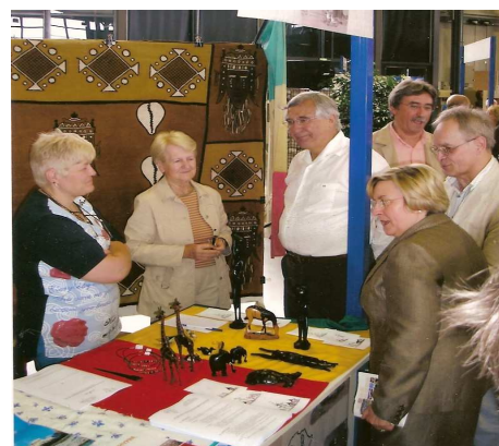
Visite du Sénateur - Maire et de Mme la Sous - Préfette sur le stand de l'association

L'association Brive - Sikasso faisait partie des 140 associations présentes le 1 er juillet à l'espace des Trois Provinces. Les nombreux bénévoles qui se sont succédés pour animer notre stand ont pu nouer des contacts intéressants et échanger avec les autres responsables associatifs engagés, comme nous, dans des jumelages ou dans des projets internationaux.