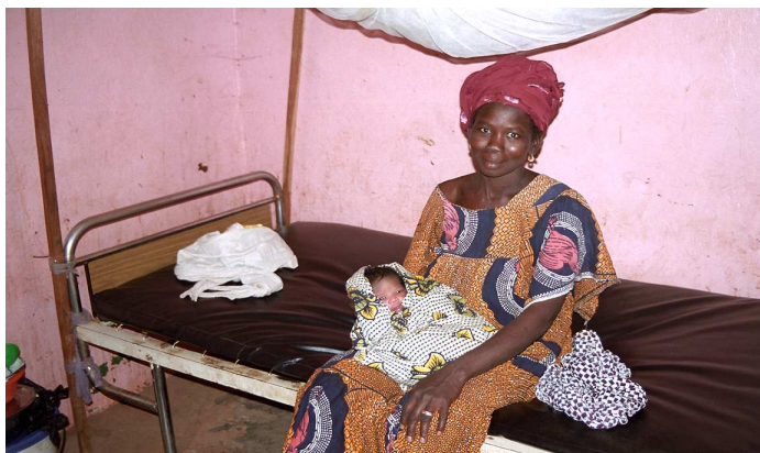
Une maman et son nouveau né à la maternité de MANCOURANI