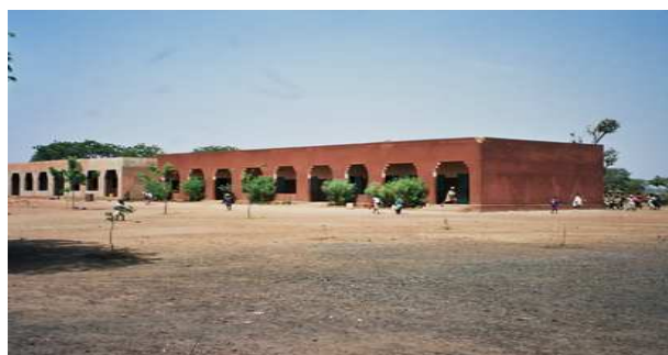
L'école TERIYA de FLAZAMBOUGOU

« Célébration des 25 ans du jumelage - coopération (1982 - 2007) »