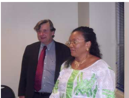
Réception du Député-Maire de Brive