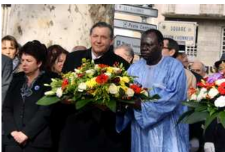
Célébration du 11 novembre