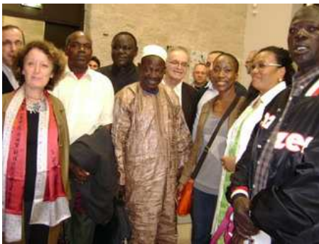
Avec Rokia Traoré

Ainsi pour conclure, en toute modestie mais fermement, je tiens à souligner que dans les moments difficiles que vous connaissez, nous demeurons à vos côtés comme nous l'avons été dans le passé et comme nous le serons dans le futur. »