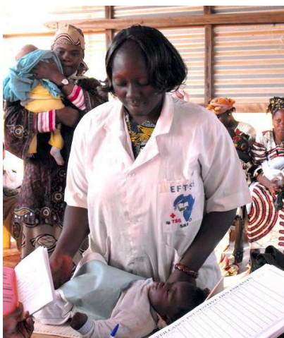
Au CESCO de Médecine