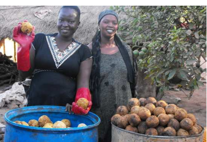
L'association Badenya Ton, soutenue grâce au microcrédit.