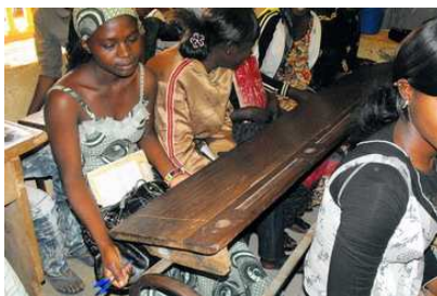
À l'École A1