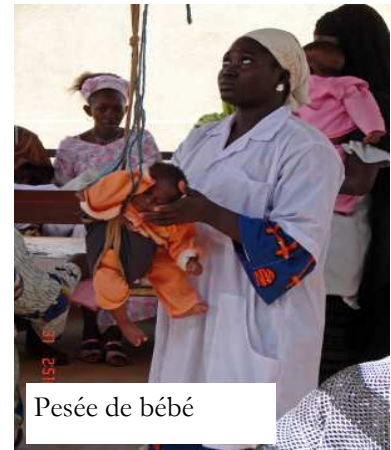
Pesée de bébé

- une aide matérielle équivalente à celle qui a été apportée à Mancourani et Wayerma.