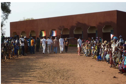
Inauguration du second cycle