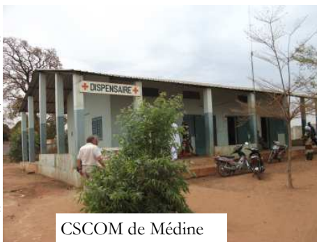
CSCOM de Médine

Les demandes les plus fréquentes restent le matériel de base, c'est-à-dire : boîtes d'instruments, chariots à pansements, tables d'examen, lits appropriés, tables d'accouchement, ainsi que tout ce qui concerne la gestion des déchets de soins (seringues, compresses usagées.....).