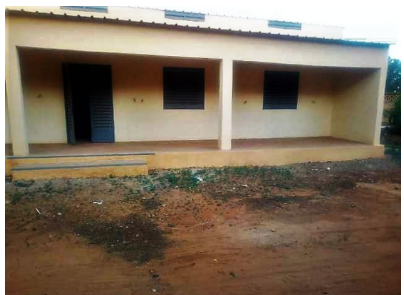
Février : réception salles de classe à Sikasso