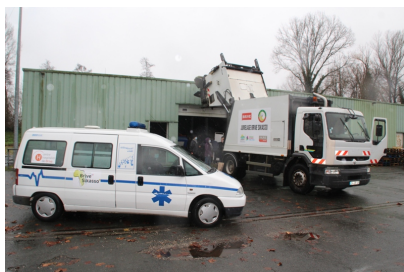
Décembre : préparation des véhicules