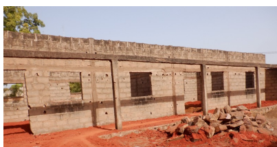
Travaux à l'Ecole B1

Je laisse à Eric Orsenna, grand amoureux du Mali, la phrase conclusive qui résume plutôt bien notre mission « l'école c'est comme un arbre, c'est du temps ». L'association Brive Sikasso se situe aussi dans le temps long.