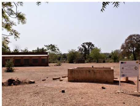
Zone de reboisement de Zandiougou

Les projets « Reboisement » reçoivent l'assentiment des responsables locaux (voir en page 4)