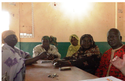
Réunion avec les associations féminines