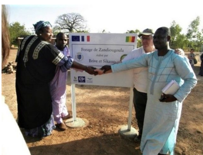
Inauguration d'un des 3 forages