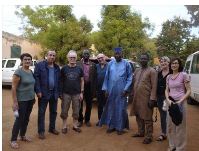
Accueil par le maire de Sikasso

La meilleure illustration en a été fournie, au cours de la mission 2019, par la tenue d'une séance de travail réunissant, à la mairie et à notre initiative, tous les acteurs de la santé de Sikasso, sans exception, autour d'un thème dramatiquement sensible, la mortalité maternelle et néonatale, sur lequel Gynécologie Sans Frontières nous avait alerté. Une « première », selon les dires de plusieurs responsables sanitaires, qui a permis d'affiner le diagnostic, partager des constats et ébaucher des axes d'amélioration. La voie est ouverte.