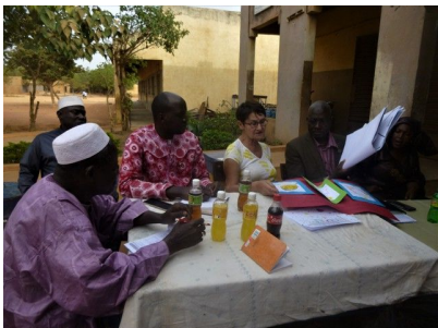
Séance de travail aux écoles de Médecine