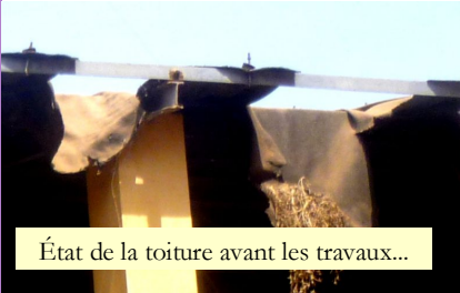
État de la toiture avant les travaux...

La toiture du CSCoM d'Hamdallaye était dans un état désastreux. Les travaux nécessaires viennent de s'achever comme en témoigne cette lettre :