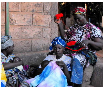
Les couturières de Badenya Ton (voir page 4)