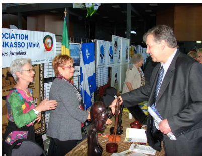
Le forum des associations (page 2)