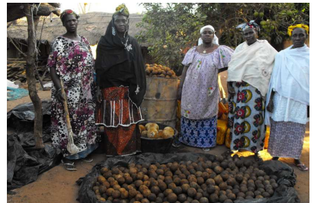
Les fabricantes de savon de Badenyaton

nyaton, est localisée à Sanoubougou. Mais deux autres quartiers ont été