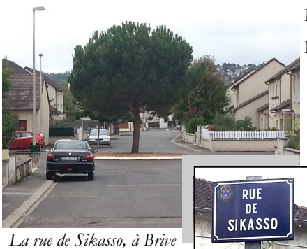
La rue de Sikasso, à Brive